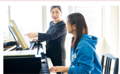
PICKUP 03 音楽I

ピアノ経験に応じたクラス分けをおこなうので、自分のペースで学べます。未経験者でも童謡などピアノの弾き歌いができるようになるカリキュラムです。卒業までには30曲程度のレパートリーを増やすことができます。