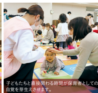
子どもたちと直接関わる時間が保育者としての自覚を芽生えさせます。