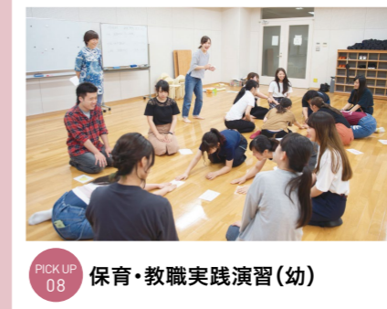
PICKUP 08 保育・教職実践演習(幼)

グループごとに創作ダンスを作ります。授業の最終回は児童学科の学生と一緒に発表会をおこないます。