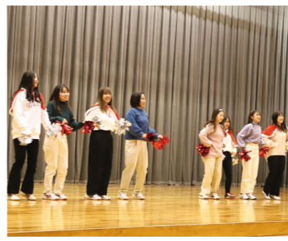
PICKUP 06 体育②(ダンス)

これまで学んできた内容と子どもの姿・保育事例を結びつけながら、多様化する保育ニーズについて学び、保育全般の理解を深めます。