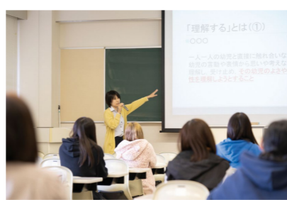
PICKUP 01 保育の心理学

一人ひとりに応じた指導ができるように、さまざまな事例から乳幼児の発達やその心理学的背景を踏まえ、幼児理解の方法を学修します。