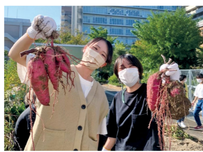
PICKUP 02 保育実習指導I

一人ひとりに応じた指導ができるように、さまざまな事例から乳幼児の発達やその心理学的背景を踏まえ、幼児理解の方法を学修します。