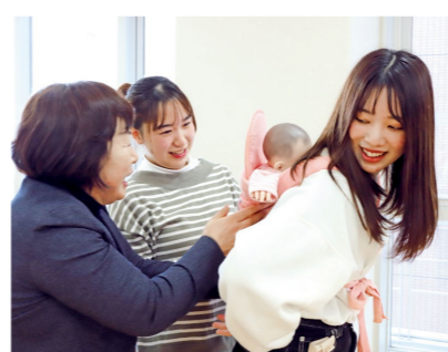
PICKUP 05 乳児保育

1年次の実習をふまえ、保育・教職実践演習や手作りイベントをとおして実践力を磨きます。