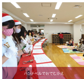
ハンドベルでおでむかえ

2017年度から年9~10回、未就園児の子育てを支援するイベント「ペンギン・クラブ」を実施しています。育児に奮闘する保護者にリフレッシュしてもらいたいという思いから生まれたもので、講義室を3時間ほど開放。保育科1・2年生それぞれが絵本のよみきかせ、ハンドベル、手遊びなど、来学した親子に楽しい時間を過ごしてもらい、子どもたちと触れ合います。