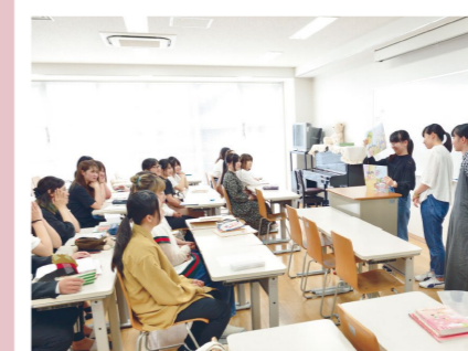
PICKUP 07 保育内容総論

この授業では、乳児保育がおこなわれている場の特徴と課題について理解を深めます。特に、3歳未満児の発達と適正な保育についての方法を学びます。